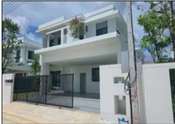
ตัวอย่างแปลงพักอาศัยบ้านเดี่ยว 2 ชั้น