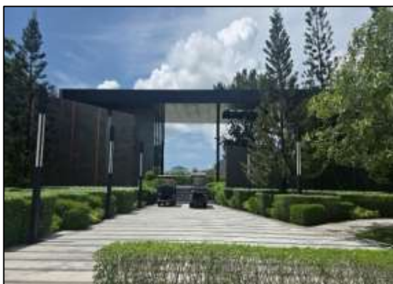
แปลงสโมสร