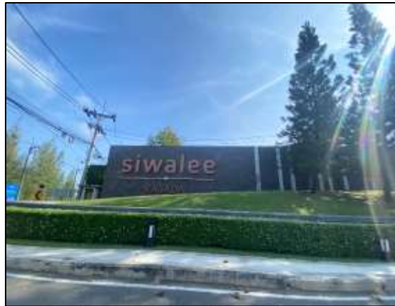
ป้ายชื่อโครงการ