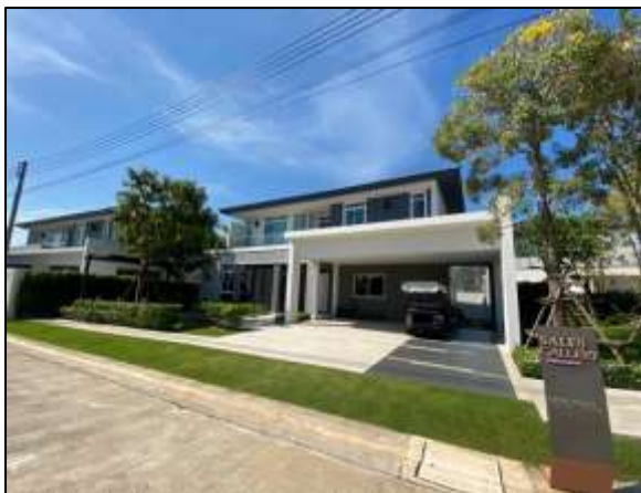
สำนักงานขาย