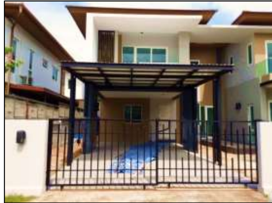
ตัวอย่างแปลงพักอาศัยบ้านแฝด 2 ชั้น