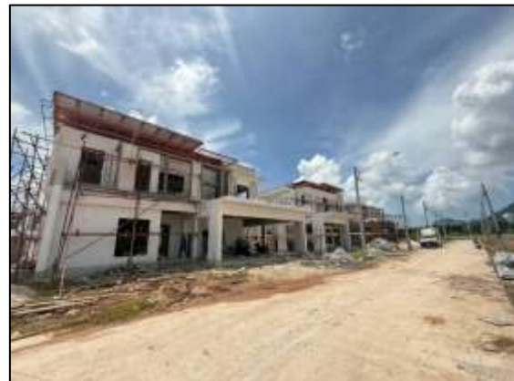
แปลงพักอาศัยที่กำลังก่อสร้างในพื้นที่จัดสรรส่วนที่ 2