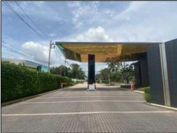
ป้อมยามด้านหน้าโครงการ