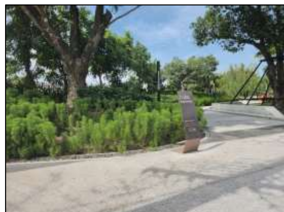
พื้นที่สีเขียว