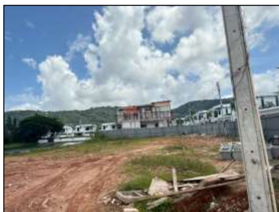
พื้นที่จัดสรรในส่วนที่ 2 (ปรับพื้นที่)