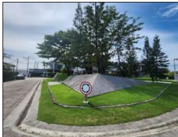
สวนหย่อม

รูปที่ 1.6-3 ภาพถ่ายสภาพปัจจุบันของพื้นที่ในส่วนที่เปิดดำเนินการ