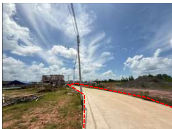
การก่อสร้างถนนค.ส.ล.ในพื้นที่ส่วนที่ 2

รูปที่ 1.6-2 ภาพถ่ายสภาพปัจจุบันของพื้นที่จัดสรรในระยะก่อสร้าง